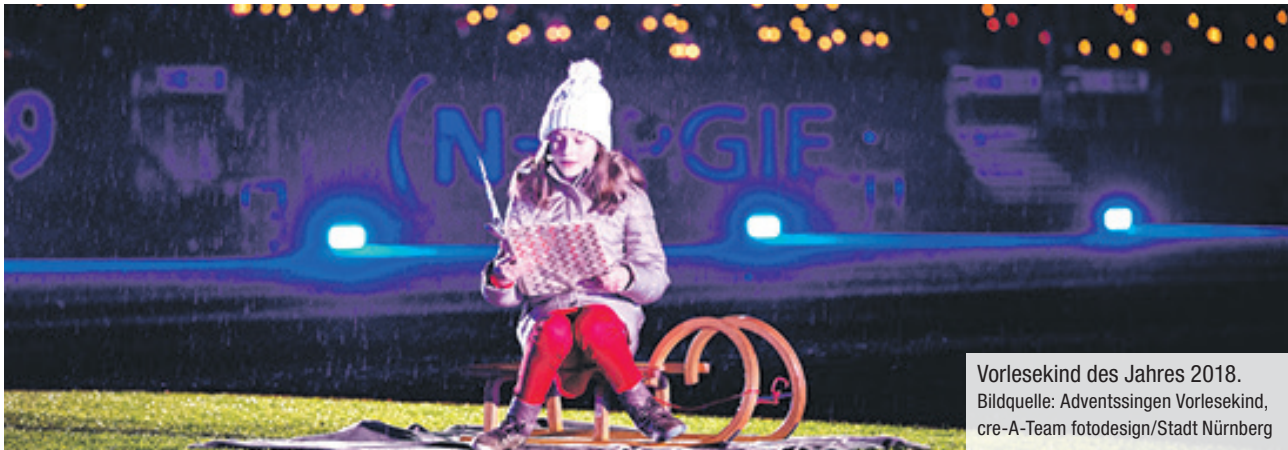
Vorlesekind des Jahres 2018.