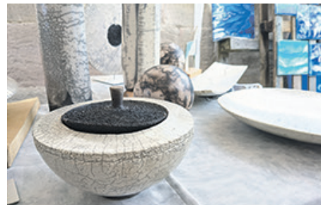
Kunst- und Designmarkt Almoshof 17.-18.06.2023

Außergewöhnliches aus der Region..., Sa., 17.06., 13 bis 19 Uhr & So., 18.06., 11 bis 18 Uhr