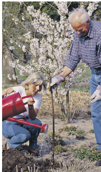
Rosen mögen lockeren, humosen Boden. Mit Rosenerde oder gut abgelagertem Kompost kann man nachhelfen.

Containerrosen werden mit festem Wurzelballen und bereits knospig bis blühend ausgeliefert. Sie sind gerade für Gartenanfänger leichter einzupflanzen – und sie blühen schon in der ersten Saison, sodass sich schneller ein motivierendes Erfolgserlebnis einstellt.