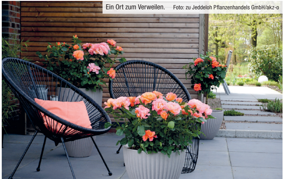
Ein Ort zum Verweilen.

Als weitere Neuheit erinnert die farbenfrohe Sugar Candy Rose mit ihrer lebendigen Farbgebung und ihrem charakteristischen Farbverlauf an Lollys vom Jahrmarkt. Trotz ihrer leuchtend orangefarbenen Knospen, die in ein sanftes Lachs-Rosé übergehen und