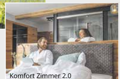
Komfort Zimmer 2.0