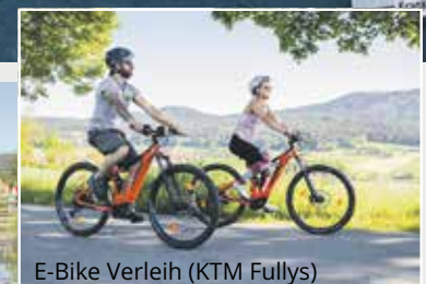
E-Bike Verleih (KTM Fullys)