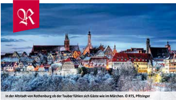
In der Altstadt von Rothenburg ob der Tauber fühlen sich Gäste wie im Märchen.

Der „Rothenburger Märchenzauber“ bietet vom 03.11. bis 25.11.2023 eine bunte Palette an Angeboten für die ganze Familie