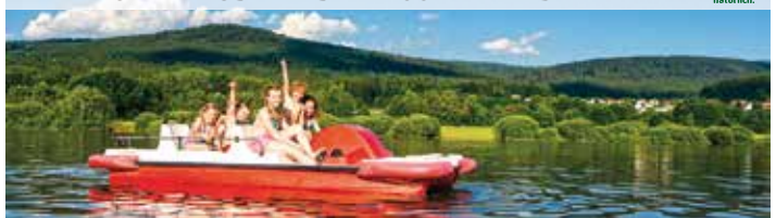
Tourist-Information Landkreis Cham • Tel. 09971 / 78 431 • www.bayerischer-wald.org