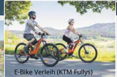
E-Bike Verleih (KTM Fulllys)