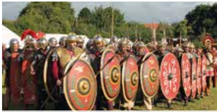
Römische Legionäre beim Römerfest Biriciana auf dem Kastellgelände

Die Museen Weißenburg laden diesen Sommer wieder zum Entdecken der Geschichte Weißenburgs ein, die bis in römische Zeit zurückreicht. Bereits am Ende des 1. Jh. n. Chr. entstand das römische Militärlager Biriciana