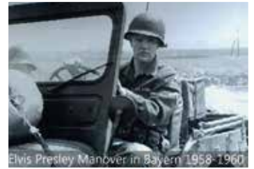
Elvis Presley Manöver in Bayern 1958-1960