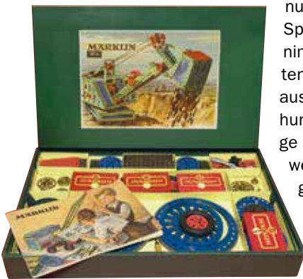
MÄRKLIN Metallbaukasten 1034, Gebr. Märklin & Cie GmbH, Göppingen, 1960er Jahre, Leihgabe: Spielzeugmuseum Sugenheim, Foto: Benedikt Feser

Zweifel in Mode, 1949 dann die steckbaren Legosteine aus Kunststoff. Weiterentwicklungen sind etwa die Systeme Baufix, Fischertechnik oder Plasticant. Doch auch technische Experimente können mit speziellen Baukästen nachgebaut werden, wie zum Beispiel mit den Metallbaukästen von Märklin.