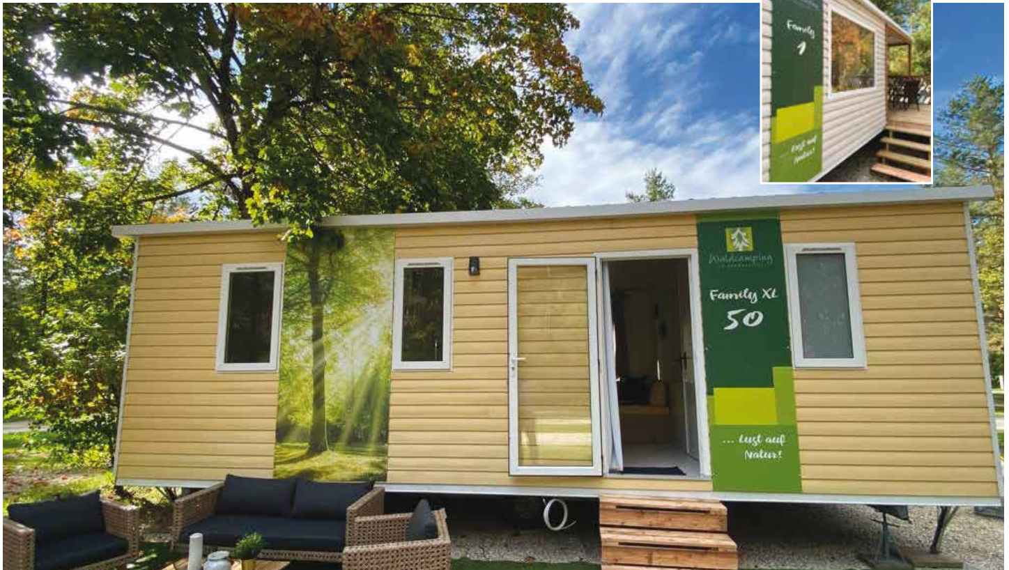
Das Mobilheim Family (kleines Foto) und das Family XL ab 58.310 Euro.

Überzeugen Sie sich von der Qualität der Häuser und unserem Vermietsystem