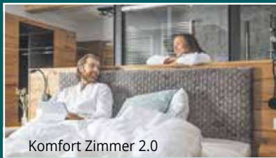
Komfort Zimmer 2.0

Familien-Appartements für 2-6 Personen ab 59,00 Tagespreis