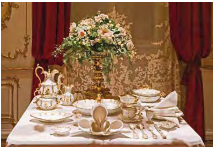
Sonderausstellung „Luxus, Wellness, Porzellan – Ein Tag im böhmischen Kurbad“ Service „Ferdinand-Form“ von Kaiserin Elisabeth, Klösterle, 1851–1858, © Schloss Schönbrunn Kultur- und Betriebsges.m.b.H, Foto: Alexander Eugen Koller / Sammlung Bundesmobilendepot

Luxus, Wellness, Porzellan – Ein Tag im böhmischen Kurbad (01.04. – 15.10.2023, Porzellanikon Hohenberg a. d. Eger)