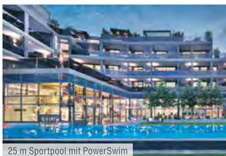
25 m Sportpool mit PowerSwim