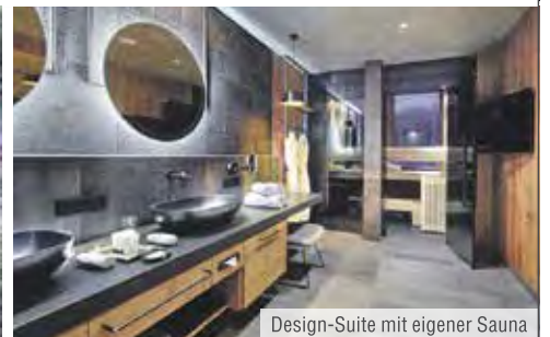
Design-Suite mit eigener Sauna