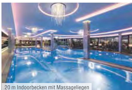
20 m Indoorbecken mit Massageliegen