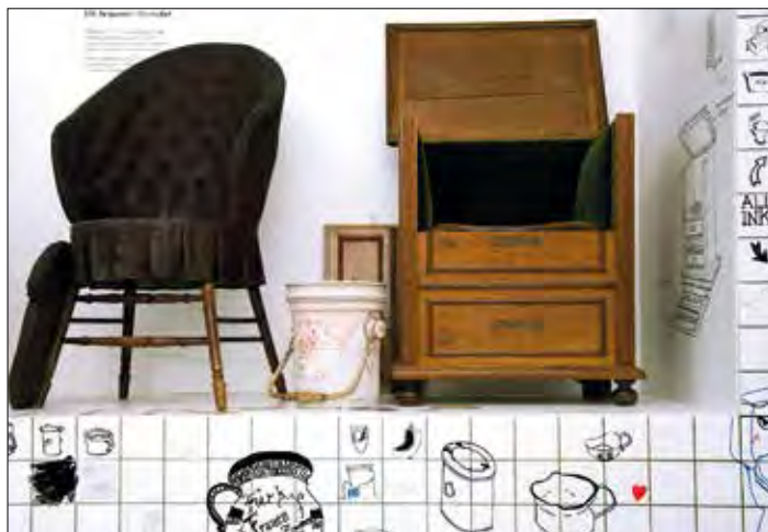
Sonderausstellung „Klo & Co. Sanitärkeramik vom Plumpsklo bis zur Hightech-Toilette“ Ausstellungsansicht LWL-Freilichtmuseum Detmold, 2016

Klo & Co. Sanitärkeramik vom Plumpsklo bis zur Hightech-Toilette (13.05. – 26.11.2023, Porzellanikon Selb)