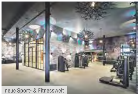
neue Sport- & Fitnesswelt