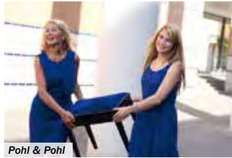
Pohl &amp; Pohl

Online-Reservierungen sind unter www.burg-rabenstein.de möglich.