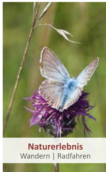
Naturerlebnis Wandern | Radfahren