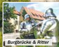
Burgbrücke & Ritter