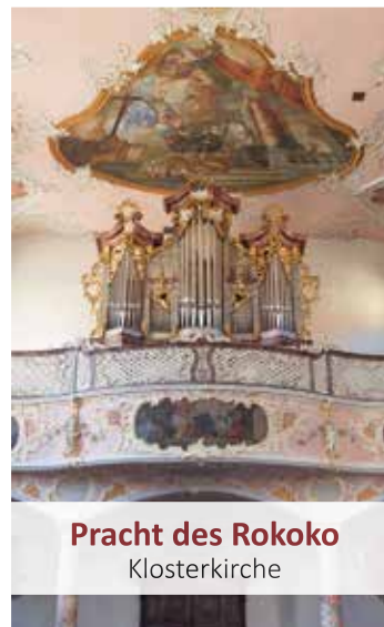
Pracht des Rokoko Klosterkirche