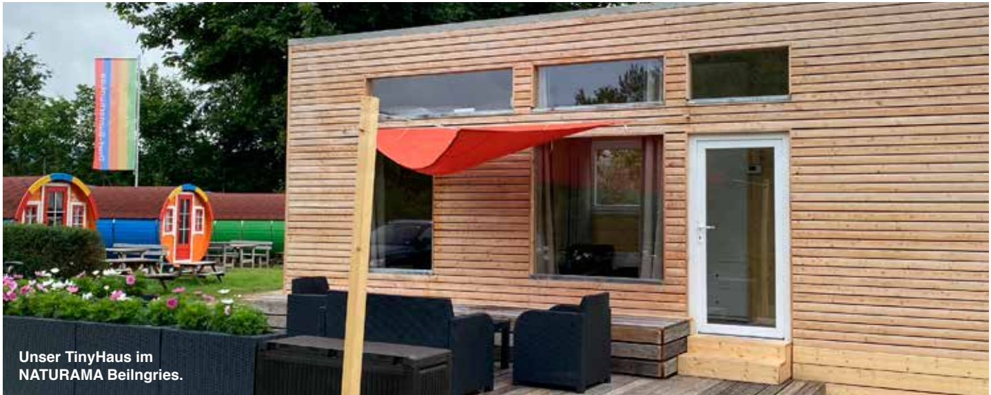
Unser TinyHaus im NATURAMA Beilngries.