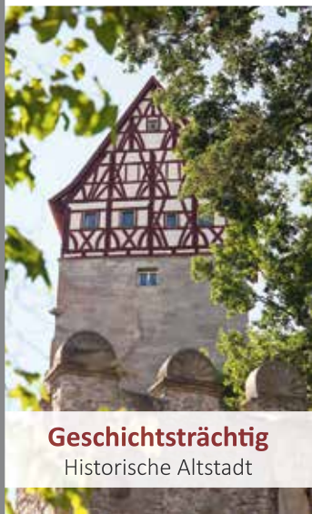
Geschichtsträchtigt Historische Altstadt

münnerstadt 1250 JAHRE Stadt | Land | Leben