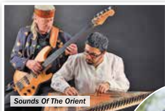
Sounds Of The Orient