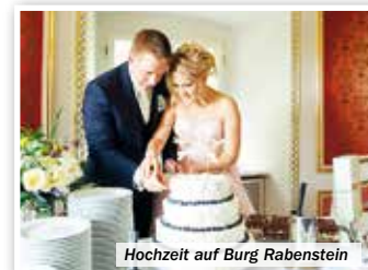
Hochzeit auf Burg Rabenstein

800 Jahre alte Burg mit ihren Prunk-, Waffen- und Rittersälen (11-17 Uhr), Führungen durch die prächtige Sophienhöhle mit ihren funkelnden Tropfsteinen und uralten Höhlenbärenskeletten (10:30-17 Uhr) und faszinierende Flugschauen in der Falknerie (15 Uhr) geboten.