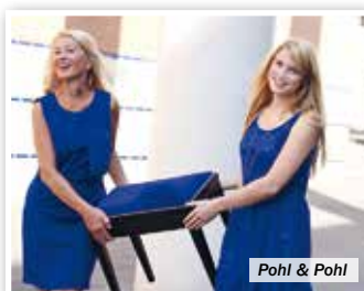
Pohl &amp; Pohl