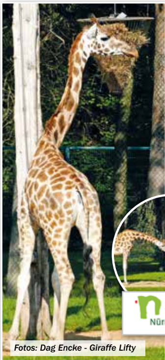
Giraffe Lifty