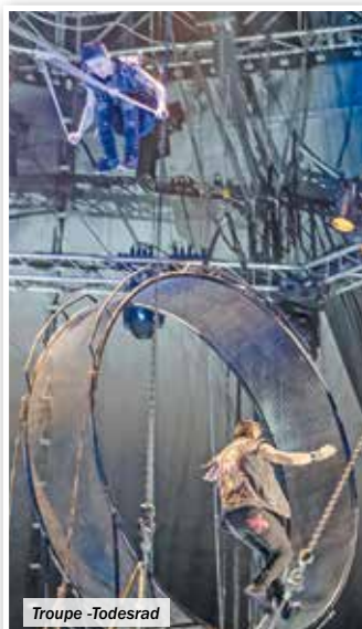
Troupe - Todesrad

Russische Schaukel, Todesrad, Globe of Speed, Ikarische Spiele und Bungee-Springer setzen weitere Glanzlichter. Aus Peking kommt ein Highlight des wieder begeisternden Programms: die „Gorgeous Girls“. Neun reizende weibliche Wesen, die die Diablos tanzen lassen. Sie beherrschen diese Kunst so präzise, rasant und elegant, dass die Augen bisweilen kaum folgen können. Die Liebhaber von Motorrad-Stunts kommen ebenfalls auf ihre Kosten. Ein Event für die ganze Familie, das begeistert, fasziniert und elektrisiert.