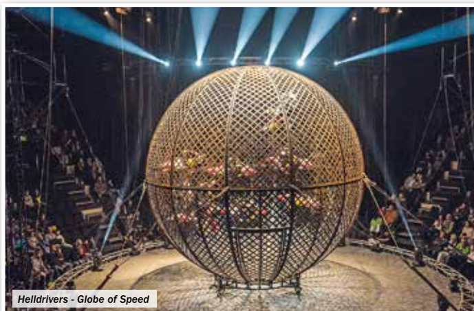
Helldrivers - Globe of Speed