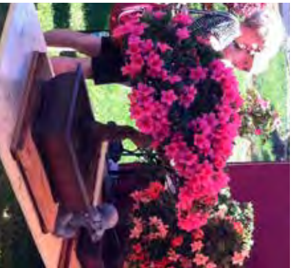
Blüten in Hülle und Fülle.

„Gartentage Beilngries“ im Sulzpark vom 08. - 10. Juni 2019 – von Samstag bis Pfingstmontag