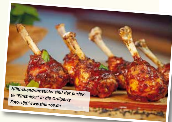
Hühnchendrumsticks sind der perfekte "Einsteiger" in die Grillparty.

Nun sollte das Hühnchen von allein auf dem Tisch stehen. Mit einem kleinen spitzen Messer auch noch den übriggebliebenen kleinen spitzen Knochen entfernen. Nun das Hühnchen mit etwas Olivenöl und dem BBQ Gewürz einreiben. Mit etwas Alufolie den obersten Knochen bis zum Fleisch einwickeln, somit wird dieser nicht zu dunkel. Das Hühnchen auf der Grillschale platzieren und diese auf die indirekte Seite des Grills legen. Deckel schließen und langsam garen lassen. Eine Handvoll Räucherchips direkt ins Feuer geben, das verleiht dem Hühnchen eine leicht rauchige Note. Grill auf 160 bis 180 Grad einpegeln, dann sollten die Hühnchen nach circa 25 bis 35 Minuten fertig sein. Die BBQ-Soße in eine Dreieckschale und ein Stückchen Butter dazu geben und sie mit unter den Grill legen. Das Fleisch alle 10 bis 12 Minuten mit der Soße und der Butter bestreichen. Kurz vor dem Servieren die Folie abziehen.