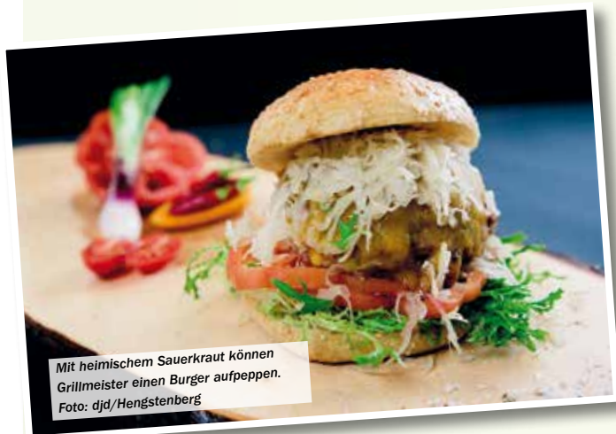
Mit heimischem Sauerkraut können Grillmeister einen Burger aufpeppen.

(djd). Rauchig-pikantes BBQ-Kraut schmeckt auch als Krautsalat zum Grillabend. Dafür das Kraut einfach abtropfen lassen und es entweder pur genießen oder mit Tomaten, Paprika und Frühlingszwiebeln kombinieren. Ebenso kann es als Zutat für einen Veggie-Burgerpatty verwendet werden. Das Sauerkraut gut abtropfen lassen und es mit Haferflocken und Mehl zu einem Patty formen. Nach Geschmack Zwiebeln, Bohnen oder anderes Gemüse hinzufügen. Auf dem Grill oder in einer Pfanne mit Öl den Patty dann kurz anbraten. So entsteht ein besonders kräftiger Geschmack, der mit den klassischen Burgerkomponenten wie Tomaten, Blattsalat und Gurken harmoniert. Weitere leckere Rezepttipps gibt es beispielsweise unter www.hengstenberg.de .