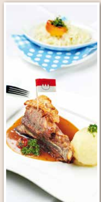
Fotos: Bierkrüge - @raa22 - stock.adobe.com | Suppe - Fotolia - kab-vision | Schäuferle - Fotolia daniel schweibert