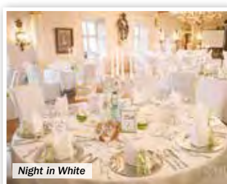
Night in White

Von Donnerstag (Fronleichnam) bis Sonntag findet am Ende der Pfingstferien der große Mittelaltermarkt statt: mit Händlern, Handwerkern, Lagergruppen, Schaukämpfen, Puppentheater und Mitmachgelegenheiten für die Kinder, Feuershow am Abend und vielen weiteren Attraktionen. Es ist der größte und beliebteste Mittelaltermarkt Nordbayerns und über 300 Akteure sorgen für Spannung und Unterhaltung.