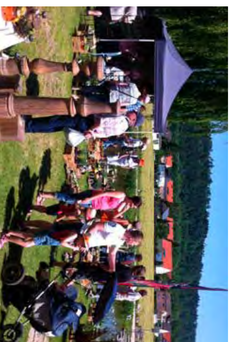
Ideales Ziel für den Familien-Pfingstaustflug.

Der Eintritt ins Blumenparadies Gartentage Beilngries kostet 6 Euro, Kinder bis 16 Jahren sind frei.