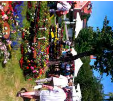
Ein farbenfrohes Pflanzen-Meer.

Die wohl schönsten Gartentage in der Region öffnen von Samstag, 8. Juni 2019, bis Pfingstmontag, 10. Juni 2019, wieder ihre Pforten. Täglich von 10 bis 18 Uhr, am Pfingstsonntag sogar von 10 bis 21 Uhr, können die Besucher bei den Gartentagen Beilngries im idyllisch gelegenen Sulzpark in ein buntes Pflanzen-Paradies eintauchen. Mehr als 80