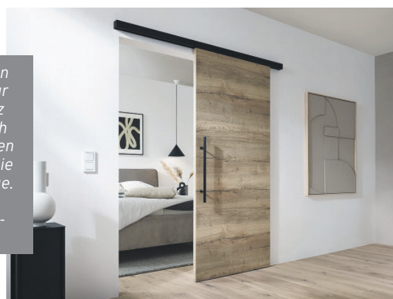
Schiebetüren nehmen nur wenig Platz in Anspruch und schaffen barrierefreie Durchgänge.

Wer es klassischer mag, kann zu Weißlack-Ausführungen greifen, die mit ihrer zurückhaltenden Optik zu vielen Wohnstilen passen. Für mehr Licht, etwa in dunkleren Fluren, bieten sich Glasschiebetüren an. Natürliche Akzente setzen Varianten aus Vollholz oder widerstandsfähigen CPL-Oberflächen. Je nach Material und Ausführung spielen Schiebetüren mal stärker mit Offenheit, mal mit Rückzug – und schaffen selbst im Loft Zonen der Privatsphäre. Einen Überblick über die verschiedenen Ausführungen, weitere Tipps und eine direkte Bestellmöglichkeit gibt es etwa unter www.türenheld.de . Neben dem Designaspekt trägt der Faktor Barrierefreiheit zur wachsenden Beliebtheit von Schiebetüren bei: Sie lassen sich leicht handhaben und bieten, insbesondere in einer zweiflügeligen Ausführung, breite Durchgänge.