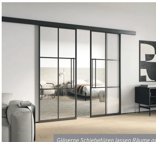
Gläserne Schiebetüren lassen Räume größer wirken und schaffen ein großzügiges Ambiente.