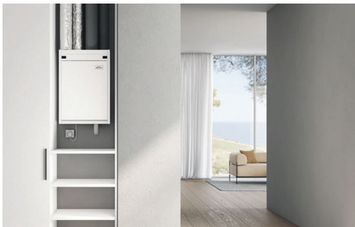
Gegen das natürliche Austrocknen von beheizten Wohnräumen: Dank optionalem Enthalpie-Wärmeübertrager können zentrale x-well Geräte wie das platzsparende Schrankgerät C225 neben der Wärme auch die Feuchte zurückzugewinnen. Das steigert den Raumklimakomfort.

Wer eine Wohnraumlüftung hat, darf natürlich weiterhin die Fenster öffnen. Der Vorteil der Lüftungsanlage besteht vielmehr darin, dass dies für ein gesundes Raumklima nicht mehr notwendig ist. Gerade in den Wintermonaten kann das den Komfort steigern: Wenn die Fenster geschlossen bleiben, entweicht keine wertvolle Heizwärme nach draußen. Die x-well Wohnraumlüftungen mit effizienter Wärmerückgewinnung halten die Wärme sogar aktiv im Raum. Dafür wird beim Luftaustausch die Wärme der Abluft auf die Zuluft übertragen, sodass diese angenehm temperiert einströmt. Das steigert die Effizienz des gesamten Gebäudes und hilft somit, Heizkosten zu sparen.