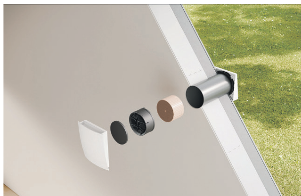
Wohnraumlüftungen sind nicht nur im Neubau möglich. Dezentrale Systeme wie der x-well D13 Pendellüfter von Kermi bieten eine besonders flexible Lösung für die Nachrüstung. Der Einbau erfolgt direkt in die Außenwand, ganz ohne aufwändige Rohrleitungen.