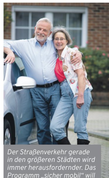
Der Straßenverkehr gerade in den größeren Städten wird immer herausfordernder. Das Programm „sicher mobil“ will dazu beitragen, dass ältere Menschen ab 65 Jahren ihre Mobilität weiterhin selbst gestalten können.