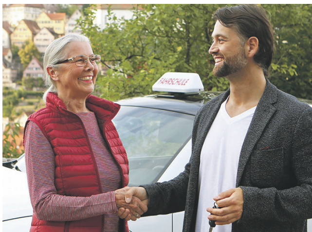
Ältere Menschen haben viele Möglichkeiten, mehr Sicherheit im Straßenverkehr zu erlangen - etwa durch eine Auffrischungsstunde in der Fahrschule.

(DJD). Mit dem demografischen Wandel wächst auch der Anteil älterer Menschen im Straßenverkehr – sowohl absolut als auch prozentual. Viele von ihnen sind zu Fuß, mit dem Fahrrad oder Pedelec unterwegs und gestalten dadurch ihre Mobilität selbstbestimmt und aktiv. Zugleich zählen sie damit zu den besonders schutzbedürftigen Verkehrsteilnehmenden. Darüber hinaus nimmt die Zahl derjenigen zu, die auch im höheren Alter noch regelmäßig mit dem eigenen Auto fahren – gerade im ländlichen Raum ist es für Erledigungen oft unverzichtbar. Statistiken zeigen, dass vor allem ältere Frauen heute viel häufiger hinter dem Steuer sitzen als früher.