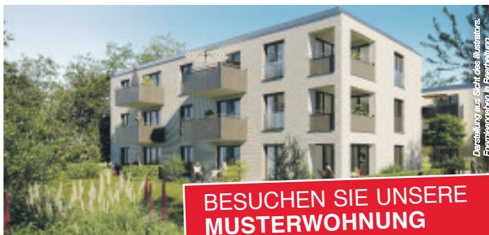
Darstellung aus Sicht des Illustrators: Energiegärten II Bearbeitung.