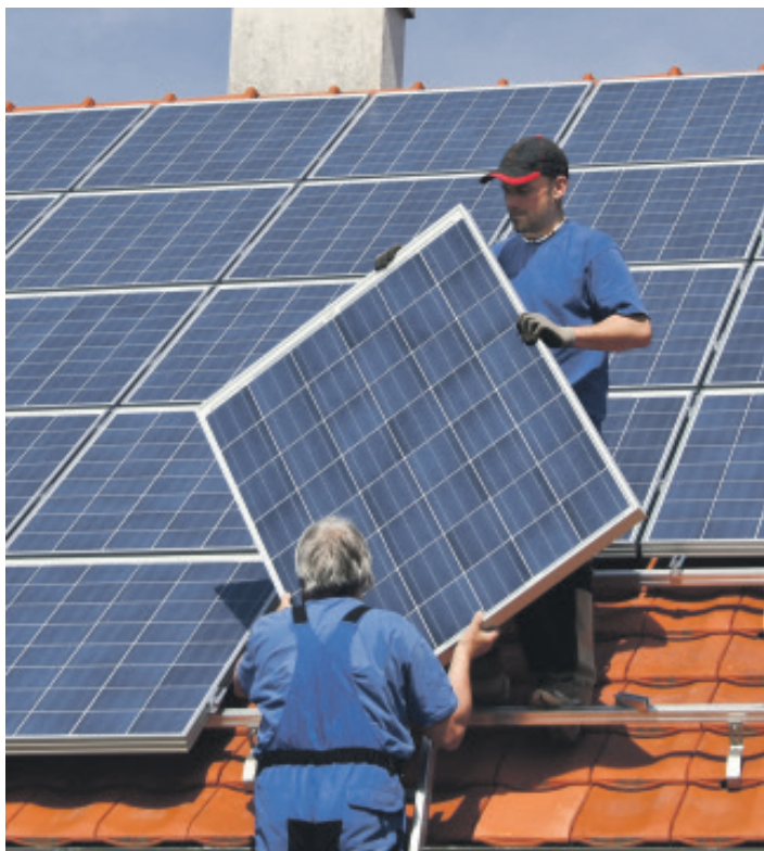
Vier von potenziell elf Millionen Häusern erzeugen in Deutschland bereits Solarstrom auf dem Dach – der entsprechende Prosumer-Index ist 2024 um 30 Prozent gestiegen.

Solarenergie: Photovoltaikanlagen und Batteriespeicher bleiben stark nachgefragt